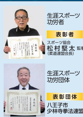
生涯スポーツ 功労者